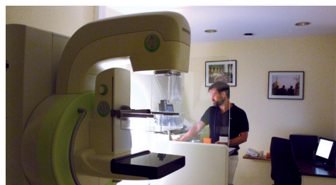
Mammographieaufnahmen werden mit mediDOK archiviert